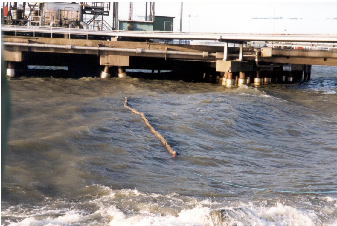
Test av sorptionslänsa i hamnbassäng