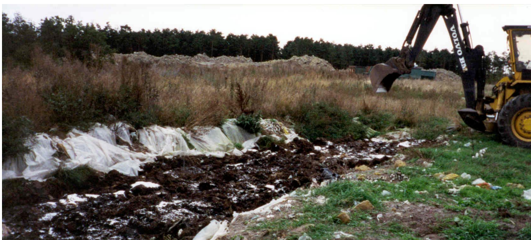
Kompostering av oljehaltigt strandmaterial

Sammanställningen i tabellform baseras helt på uppgifter från tillverkare och leverantörer antingen som svar på frågor ställda i enkäten eller genom bifogad produktinformation. Inga egna tester eller prövningar från IVL:s sida ingår i presentationen av data.