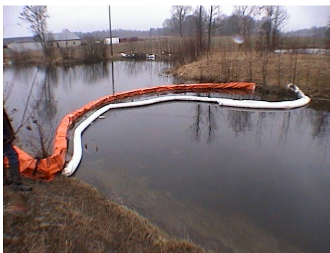
Sorptionslänna tillsammans med skyddslänna i rinnande vatten

Testtemperaturen i standardmetoden har angetts till 23 \pm 4 °C (rumstemperatur), vilket täcker intervallet 20 \pm 1 °C som användes här. Det är motiverat att hålla konstant temperatur i testen för att jämförbarheten skall bli optimal och rumstemperatur är i de flesta fall lätt att kontrollera. Rumstemperatur kan också representera användningar inomhus. För användningar utomhus kan i vårt land två temperaturer vara av intresse. Temperaturer på 0 och 15 °C kan representera genomsnittstemperatur för utomhusförhållanden i vatten under vinter och sommar. Under förutsättning att konstant temperatur kan hållas vid dessa lägre temperaturer, bör metodiken kunna anpassas till test vid sådana betingelser.