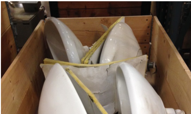
Figur 3. Lastning och emballering av tvättställ, blandare eller utslagsbäckar på lastpall.