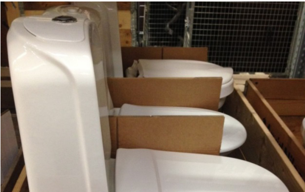
Figur 2. Lastning och emballering av toalettstolar på lastpall.