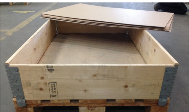
Figur 4. Pallkragar för att kunna stapla flera lager ovanpå varandra.