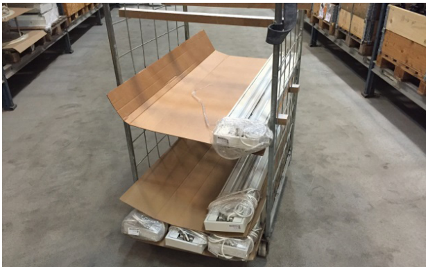
Figur 3. Stapling av pendelarmaturer i lastbur.