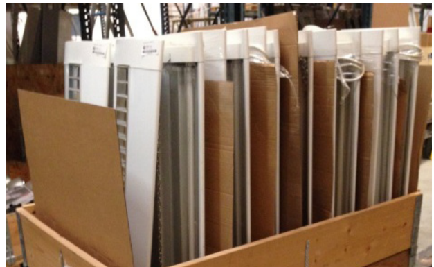
Figur 6. Stabiliseringsbånd ssmänhåller pallkrågarna med själva lastpallen och hindrar armaturerna från att rasa eller välta.