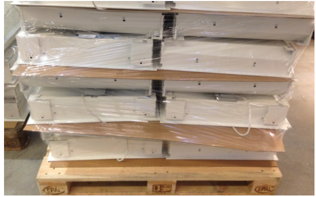
Figur 2. Stapling av infällda armaturer på lastpall.