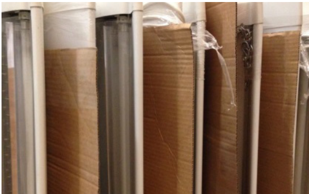
Figur 5. Hantering av pendelarmaturer med skyddande kartong emellan.