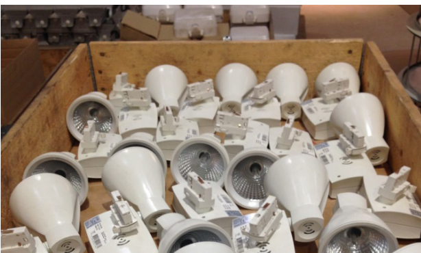
Figur 7. Emballering av spotlights.