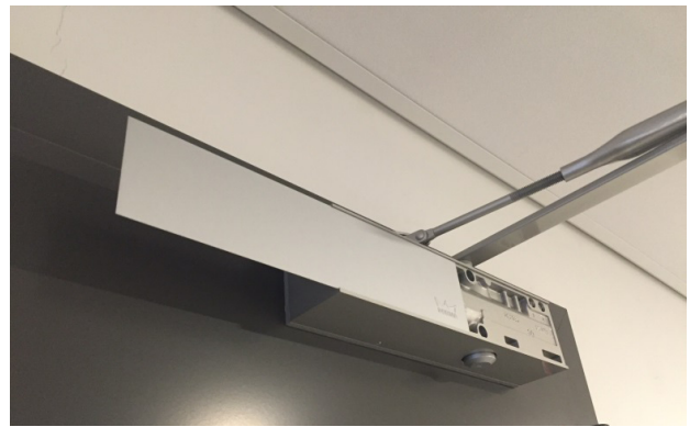
Figur 2. Dörrstängare inklusive täckplåt.