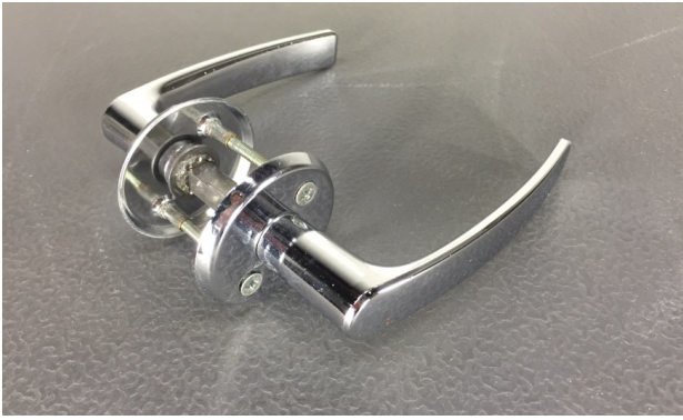
Figur 1. Hopsättning av handtagen/beslagen efter demontering så tillhörande skruvar inte tappas bort.