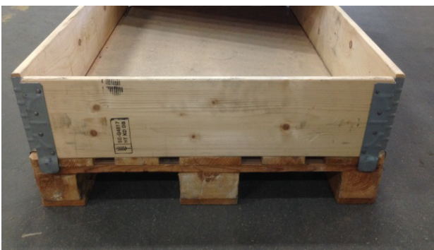
Figur 5. Pallkragar för att kunna stapla flera lager ovanpå varandra