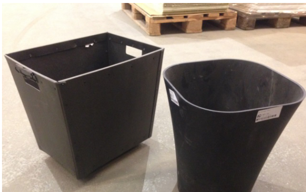
Figur 3. Kartonger, plastlådor eller plastpåsar (alternativt papperskorgar eller liknande) för lagring av beslag.